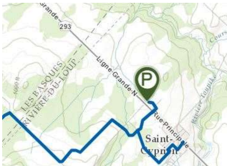
Sentiers 4 saisons